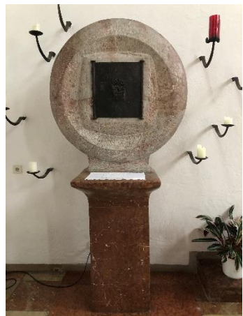
Zu den Hl. 14 Nothelfern