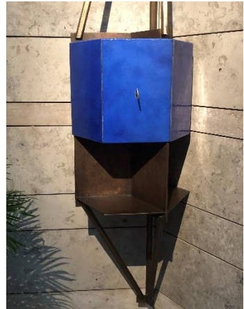
St. Katharina von Siena